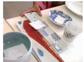
提供いただいた器を選び、どんな料理を盛りつけるか思案しました。