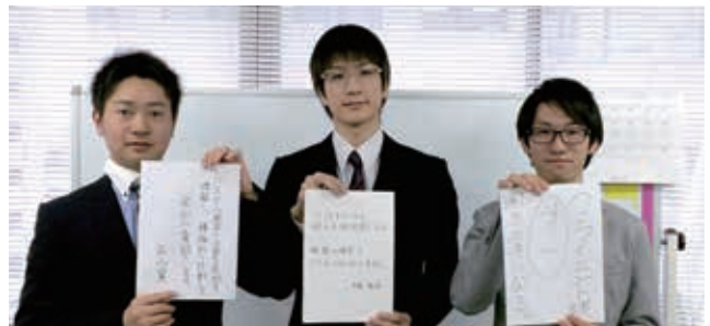
全員で目標を共有しました。緊張しました…

福祉施設や病院等で活用が見込まれる新システム開発のため、混成チーム(2大学3名)で取り組みました。システム開発班と営業班に分かれ、プログラム開発、機器選定、試用企業様の開拓等に取組みました。実際にクライアント様にシステムの試験運用を体験いただき、商品としての通用度確かめるなど、正社員と同様の企業体験をさせていただきました。試験運用ではプログラムや機器の不具合、プレゼンの失敗などもありましたが、担当者様からの熱心なご指導の下、販促企画までには到達できませんでしたが、何とか商品のプロトタイプを作り上げることができました。仕事を行う上では、100%以上の力を注がないと事が成り立たないということを全員が自覚できたインターンシップでした。