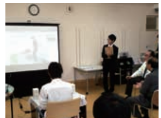
デモンストレーションの時です。