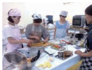
出来上がったレシピを実際に調理している様子。