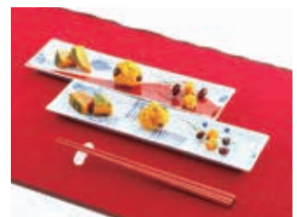
写真スタジオで撮影しました。