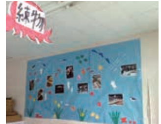
作成した吊りPOPと壁紙です。