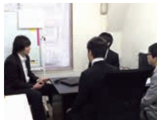
社内打合せの様子です。