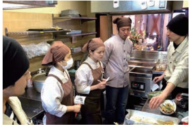
厨房での実習中。真剣なまなざしで調理の方法を聞いています。

今まで一度も包丁を握ったことがない、アルバイトもしたことがない、混成チーム(3大学3者)で取り組みました。そんな学生が店舗の従業員の方とともにサラダ作りから揚げ物、レジ打ち等、汗を流して働く中で、働くことの厳しさに触れました。また、お客様が食べたいもの・買いたいものを調査するために、飛び込みでの周辺の会社に聞き込み調査・・・怖くて足が震えました。しかし、お客様のニーズを基に企画して販売した「春色バランス弁当」は、彩りも味も学生ならではのアイデアが詰まったものとなりました。販売目標達成率は95%と100%には一步届きませんでしたが、実習最終日に「いなくなるとさびしいね」とお店の方に言っていただいたことが学生にとって何よりの喜びでした。