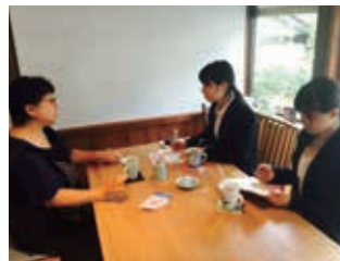
窯元様への取材風景。とても緊張しました。

“食のまちづくりアドバイザー” 地域活性化を目指す企業で、伊万里焼の窯元紹介・レシピブックの作成に取り組みました。多数の窯元の魅力を発信したいと考え、1件1件を訪問し丁寧に趣旨を伝え、多くの窯元様に賛同いただき、当初の目標以上に取材許可と器の提供を得ました。健康栄養学科の学生が主にレシピを作成、マスコミ志望の学生が主に記事を作成。専門性を活かしたチームワークで目標を達成しました。その過程の中で、器の見せ方や簡単料理方法を獲得した学生。また、窯元の熱い思いに文章の責任を感じた学生。全ての過程で想像力を膨らませ、先を考えて行動することの重要性を学ぶインターンシップでした。