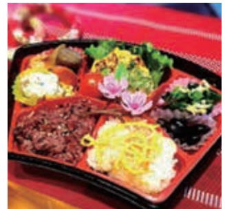
実習の成果として提案した「春色バランス弁当」!