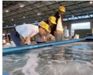
店舗について担当者様より話をうかがっています。