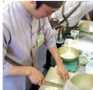
持ちなれない包丁を持ち、緊張の作業。